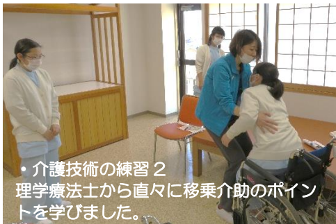
・介護技術の練習2 理学療法士から直々に移乗介助のポイントを学びました。