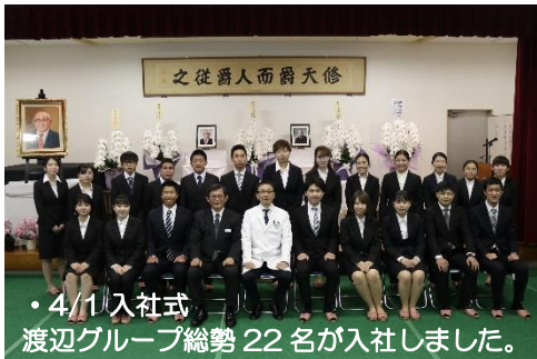
・4/1入社式 渡辺グループ総勢22名が入社しました。