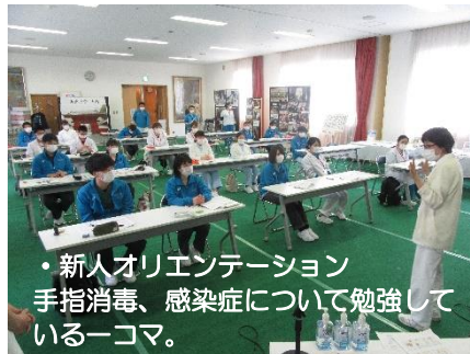
・新人オリエンテーション 手指消毒、感染症について勉強しているコマ。