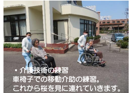
・介護技術の練習 車椅子での移動介助の練習。 これから桜を見に連れていきます。