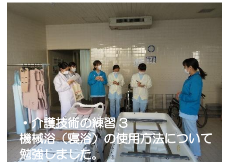
・介護技術の練習3 機械浴(寝浴)の使用方法について勉強しました。