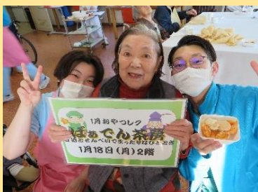
1月 えびせんとお茶会