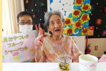
8月 フルーツシャーベット