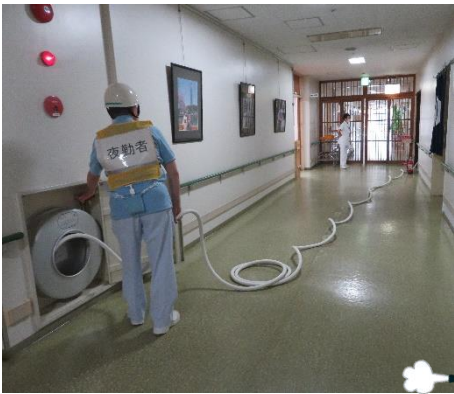
初期消火と消火栓の訓練