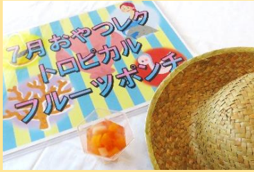
7月 フルーツポンチ