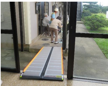
非常口からの避難誘導訓練