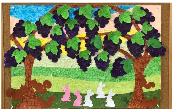
作品名「動物たちもぶどう狩り」 製作期間 1ヶ月