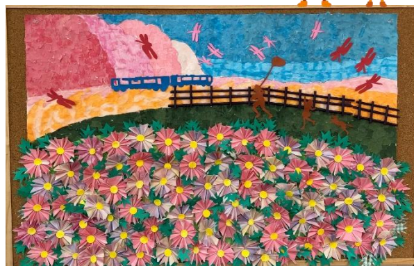
作品名「コスモスと秋を迎える」 製作期間 1ヶ月

昨年は、個人で「ちぎり絵」作品を行っていましたが、利用者さまから“大きな作品を作りたい”と声が上がリ、大作に挑戦しています。彩りよく、立体的な組み合わせが特徴です。賑やかな会話も皆さまにお届けできたらうれしいです。