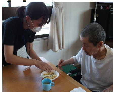
非常食の活用及び非常食の介助(実習生にも参加してもらいました！)