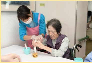
10月 かぼちゃケーキ