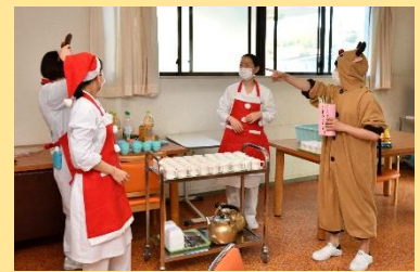
12月 クリスマス合同開催