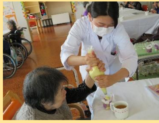
11月 さつまいもモンブラン