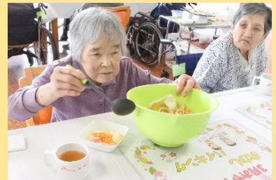
3月 お煎餅バイキング