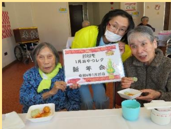
1月 新年会合同開催