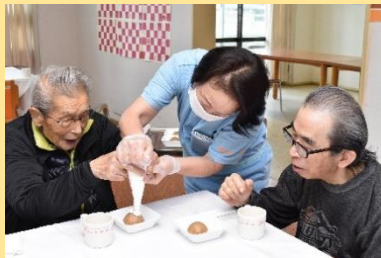
2月 チョコ蒸しパン