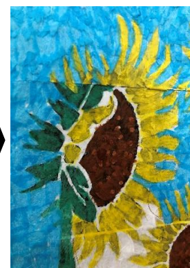
手先を使った器用な作品に圧倒！