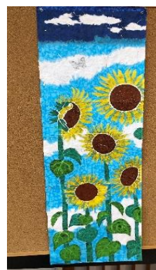
夏を感じる ヒマワリのちぎり絵