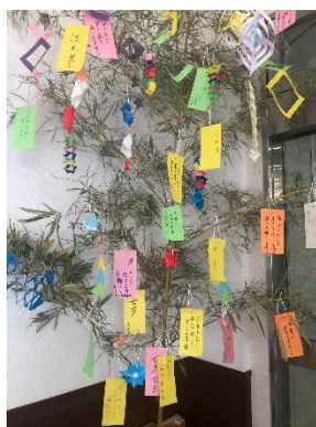
玄関には利用者さまが作った短冊がお迎え