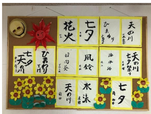
書道クラブの作品 夏に関するものばかりで季節感が漂っています