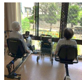
仲良くリハビリ中

デイケアでは、利用者さまがクラブ活動に参加され、素晴らしい作品を届けてくれます。頑張ってリハビリテーションに励みながら卒業を目指し、ご自宅で一日でも長く生活できるよう、サービス向上に努めてまいります。