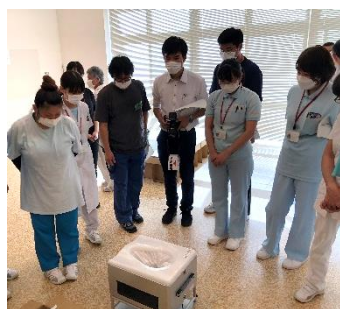
災害用トイレラップポン（組み立てトランク型自動ラップ式トイレ）について説明を受けました。