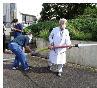
消火栓の使用方法や注意点などの指導を受けました。