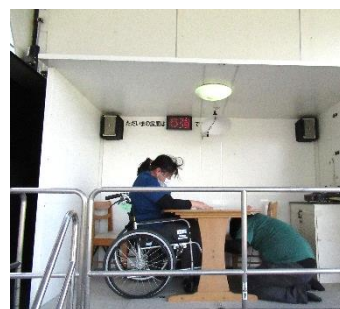
施設利用者を想定して車椅子で震度6強を体験しました。