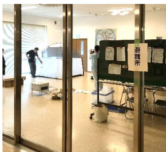
段ボールベッドの体験や組み立て方法を確認しました。

今後も地域住民や美浜町、グループ職員が一緒になって、防災・減災意識の向上や災害連携の強化に努めていきたいと思えます。