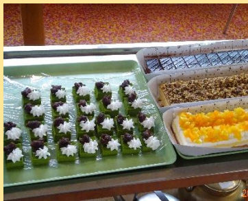
10月 秋のケーキバイキング