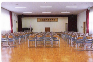
12 渡辺病院附属会館